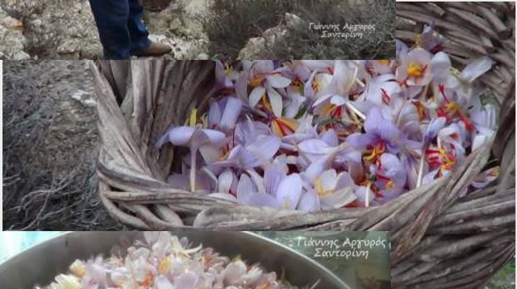
Γιάννης Αργυρός Σαντορίνη