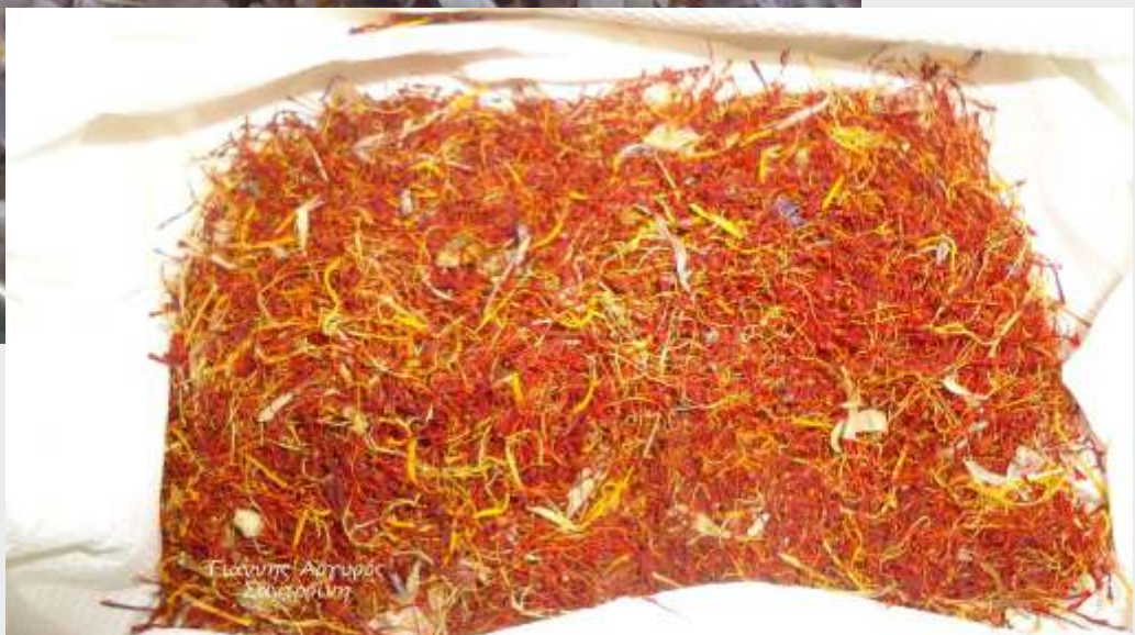
Γιάννης Αργυρός Σαντορίνη